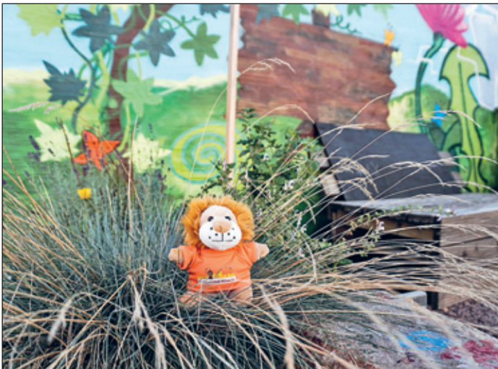
Mitti im Stadtgarten