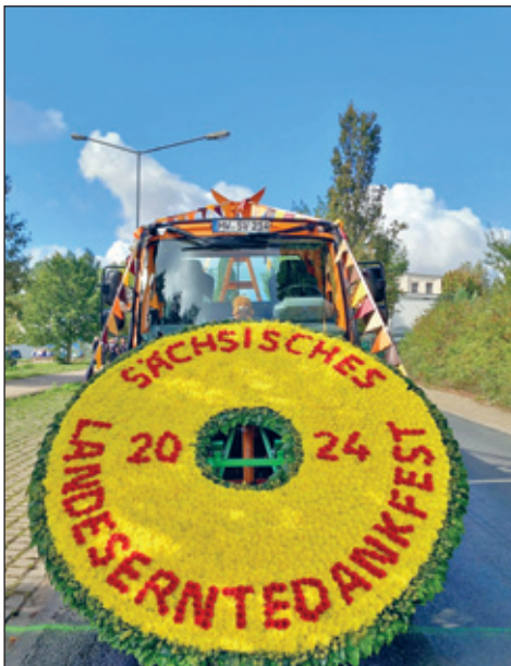
Blumenscheibe Festumzug, Foto: Harald Kaehs