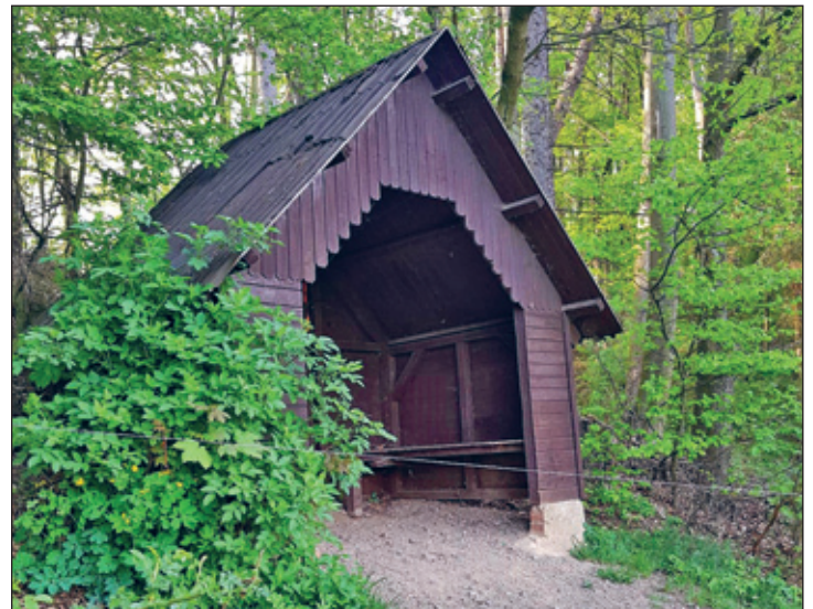
Wanderhütte in Lauenhain vor der Instandsetzung

Als Ortschaftsrat wollen wir, mit Hilfe unseres Ortsteilbudgets, eine weitere Maßnahme umsetzen. In dem Zusammenhang haben wir uns zum wiederholten Male erfolgreich um Fördermittel beworben. Diesmal soll das Dach der Wanderhütte an der ehemaligen Fuchsfarm in Lauenhain erneuert werden. Gleichzeitig wird im Inneren eine Informationstafel installiert. Mit dieser wollen wir auf die Geschichte der Fuchsfarm und des nahen Lauenhainer Skihanges hinweisen.