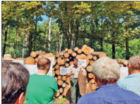
Begehung des Rossauer Waldes mit dem Revierförster.