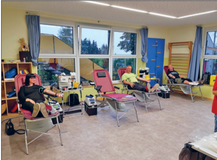
Teilnehmer bei der Blutspende